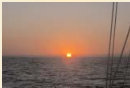
Il sole dell'alba ci accoglie in Sardegna

In Italia la situazione è un po' diversa, in quanto i porti turistici sono meno numerosi che altrove nel Mediterraneo ma quello che colpisce negativamente è la totale mancanza di regolamentazione del settore. Qui da noi, ogni volta che decidi di entrare in un porto lo fai a tuo rischio e pericolo. Non sai mai cosa ti aspetta quando sarà il momento di passare alla cassa. Non esiste un criterio riconducibile a principi di razionalità, ciascuno fa come gli pare. Inoltre, come se non bastasse vedersi richiedere - in alcuni casi - cifre folli, può capitare, in particolare al sud, di non riuscire a capire, tra i numerosi individui che si avvicinano alla banchina per chiedere denaro, quali siano realmente legittimati a farlo. Succede anche, come in un Far West senza legge né sceriffi, di vedersi rifiutare l'ormeggio ad una banchina pubblica perché qualcuno ha deciso