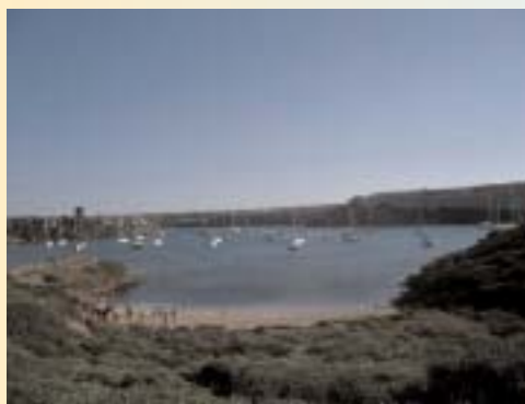
Nel rifugio del Lazzaretto di Mahon

Dopo qualche ora ci rimettiamo in viaggio verso il porto che si trova in fondo al fiordo. Ci aspettano a terra e perciò cerchiamo un approdo. Sui pontili molte barche letteralmente sommerse da sciami di ragazzine che lavano, spolverano, battono tappeti e cuscini, tirano a lucido i candelieri: uno