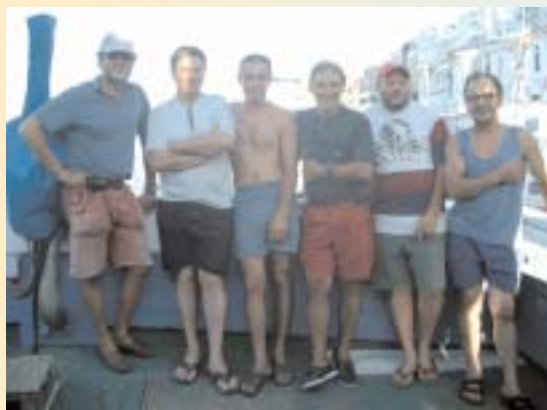
Con l'equipaggio del Lorenzo Junior

Davanti a noi più di 30 ore di navigazione prima dell'arrivo a Oristano. Raramente capita, nella vita di ogni giorno, di avere tanto tempo per pensare, lontani da telefonini, TV e altri strumenti di distrazione. Così ci lasciamo andare a qualche riflessione. Il pensiero corre a quaranta, cinquanta fa, quando a prendere il mare per il solo piacere di navigare erano in pochi, tutti gli altri essendo spinti a farlo dalla necessità, pescatori o marinai che fossero. Erano tempi in cui le poche barche a vela