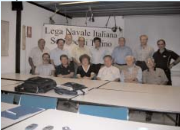
Il nuovo Consiglio Direttivo

Associazione. Molto nutrita, l'agenda impegni dei prossimi mesi. E' in pieno svolgimento il corso autunnale