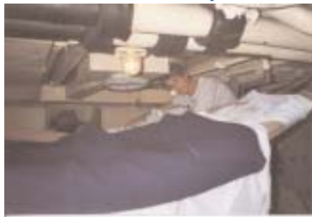
In branda si dorme comodi!

Emozioni di posti visti, di gente conosciuta anche solo per poche ore, di amicizie intense perché fiorite in condizioni singolare e forse per questo, e per la lontananza, destinate a consumarsi in fretta come un fuoco di paglia; emozioni forti, che rimarranno nel ricordo sbiadito di un album di foto, ripreso volentieri