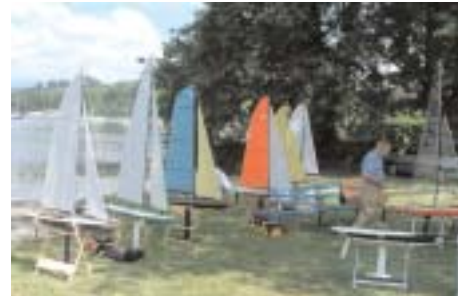
La flotta in gara