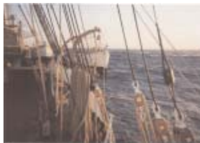
Scorcio su pastecche e bigotte

Per le 17,15 è previsto il posto di manovra generale.