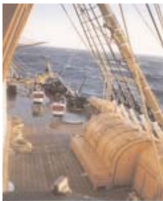
Lato dritto verso prua

Il comandante ha deciso di tenere la rotta al largo e questo è il risultato...Non sappiamo quando arriveremo a Cadice.. Si balla notevol-