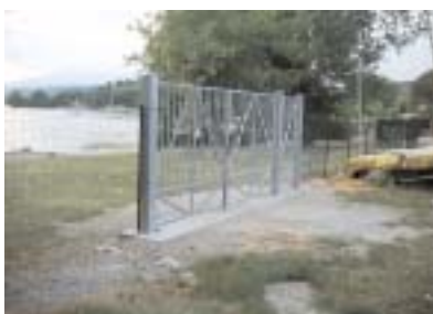
Cancello dall'interno chiuso

Pertanto, contestualmente all'atto dell'iscrizione al GVT per il 2005, verrà fornita la Chiave A a tutti i soci che rimessano la barca a Viverone, purchè in regola con i versamenti per il 2004. Per tutti gli altri iscritti al GVT, verrà consegnata, a richiesta, la Chiave B.