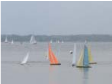
La flotta sul lago

Louis Voutiton cup e l'America's cup si sono disputate in Italia. Nei giorni 6 e 20 giugno 2004 le acque del lago di Viverone hanno visto la disputa di una regata per modelli di barche a vela radiocomandate ispirate alla grande sfida; il Gruppo Modellisti ha organizzato