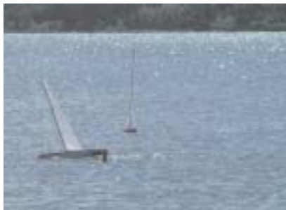
Velieri radiocomandati in boa

Louis Voutiton cup e l'America's cup si sono disputate in Italia. Nei giorni 6 e 20 giugno 2004 le acque del lago di Viverone hanno visto la disputa di una regata per modelli di barche a vela radiocomandate ispirate alla grande sfida; il Gruppo Modellisti ha organizzato