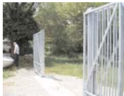
Cancello dall'interno aperto

Le suddette chiavi non sono duplicabili così come quella attuale del cancello lato strada.