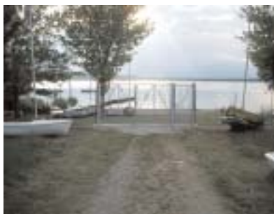
Vista cancello dall'interno della base

Poichè questo servizio, che, in aggiunta alla nuova recinzione, contribuisce a tutelare le proprietà della Lega Navale e dei soci, ha comportato una spesa sensibile, le chiavi verranno consegnate previo deposito cauzionale e contrassegnate da un numero. All'atto della consegna verrà compilata una scheda con i dati del socio, il numero di chiave, data di consegna e importo della cauzione.