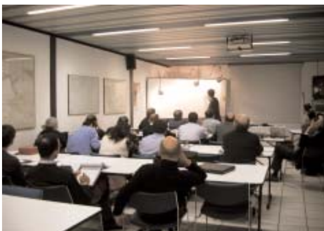
L'aula grande nella Sede di Torino