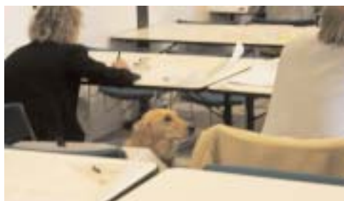
La Lega Navale è aperta a tutti!!

Tasse e pratiche esami: Iscrizioni, tasse, versamenti, bolli, barca per l'esame € 90