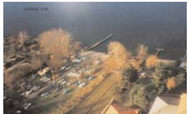
Viverone - Vista dall'alto della base nautica

Nei corsi autunnali chi ha fatto già il corso di primavera il costo è di 80 €uro