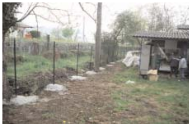
Viverone - Il recinto lato stradina di accesso al lago