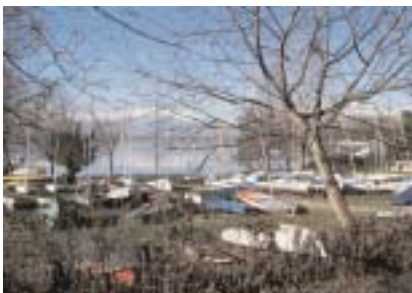
La base nautica di Viverone

La quota di partecipazione è di: 130 Euro - comprende l'iscrizione alla LNI, al Gruppo Vela Torino e alla Federazione Italiana Vela.